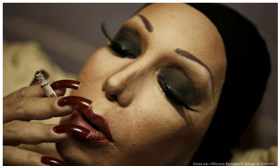
Szene aus »Obscuro Barroco«

Die Form eines magischen Essayfilms wählte die in Paris lebende Griechin Evangelia Kranioti für ihre Produktion »Obscuro Barroco« über Rio de Janeiro. Sie arbeitet ebenfalls als Fotografin und Videokünstlerin und will in ihrem Film den Kern der