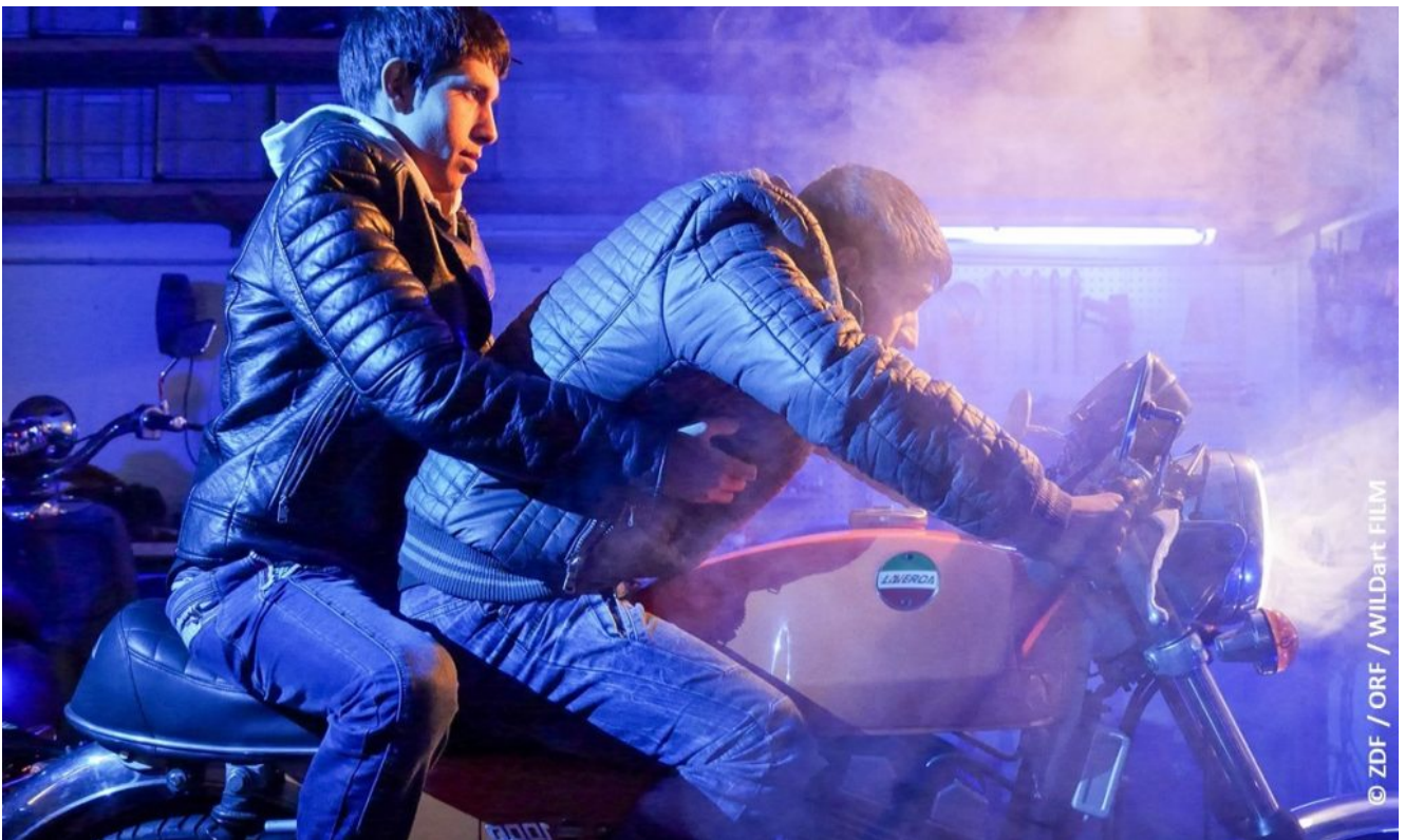
Filmausschnitt aus "Die Brüder der Nacht"