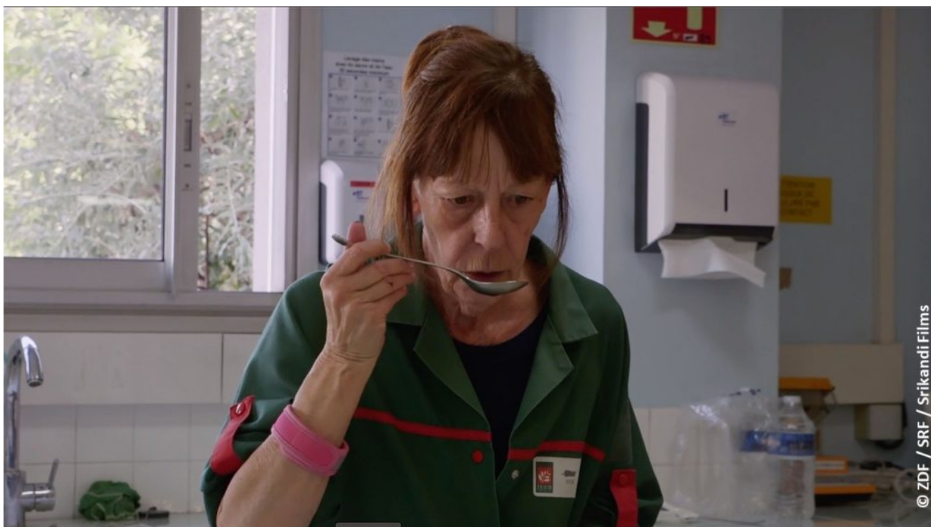
Filmausschnitt "Geschmack der Hoffnung"

16.11. um 22:30 Uhr: Bewegungen eines nahen Bergs (2019, Sebastian Brameshuber)